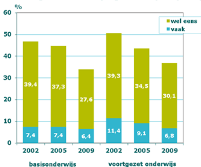
Percentage kinderen en jongeren dat pest (2009)

Pesten komt zowel op de basisschool als in het voortgezet onderwijs vaak voor. Ruim een kwart van de scholieren pest af en toe. Het aantal leerlingen dat pest is de afgelopen jaren licht gedaald. Ruim 6% van de leerlingen zegt vaak te pesten, dit percentage is in het voortgezet onderwijs iets hoger dan binnen het basisonderwijs (HBSC 2009). Jongens pesten op alle leeftijden vaker dan meisjes. Vmbo-leerlingen pesten vaker dan vwo-leerlingen. In de afgelopen jaren zijn er verschillende onderzoeken uitgevoerd naar het pestgedrag van leerlingen en jongeren. Er zijn drie grote monitoren die elke paar jaar herhaald worden: het HBSC-onderzoek, de Nationale Scholierenmonitor en de Monitor Jongeren en Internet.